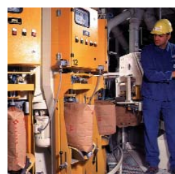
Piese de schimb la o instalatie de insacuit CP