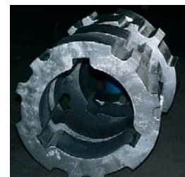
Rola de concasor pentru racitorul de clincher CP