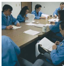
Instruire de mentenanta