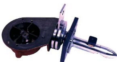
Rezervni delovi Claudius Peters postrojenja za pakovanje