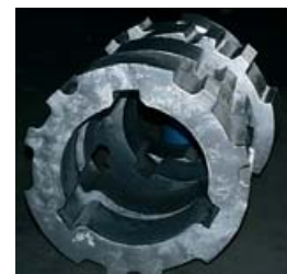
Prsten za drobljenje Claudius Peters hladnjaka klinkera