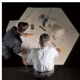
Claudius Peters inženjerska podrška