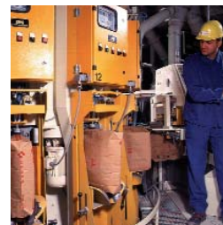
Servisiranje Claudius Peters postrojenja za pakovanje