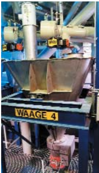
Sistema de Mistura para operação por batelada

De acordo com nossa experiência, aproximadamente 70% dos processos de mistura são executados em sistemas por batelada, com uma capacidade de até 250 t/h.