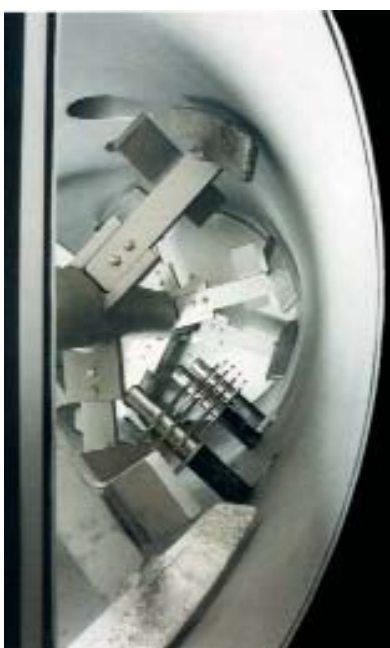
Elementos de mistura