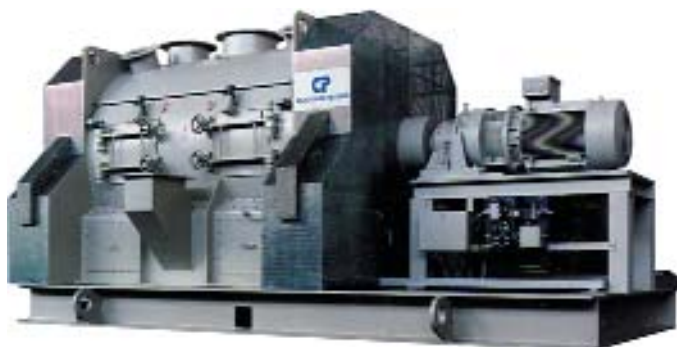
Misturador por batelada HTC 6100

Adicionalmente, um conceito de despoeiramento altamente eficiente garante produtos absolutamente puros, e uma produção que atende às especificações de respeito ao ambiente.