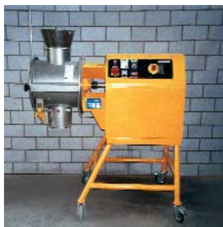
Misturador do Centro Técnico

Nosso misturador de laboratório é projetado com um volume bruto de 3 litros, facilitando diferentes aplicações em ciência, tecnologia e teste de materiais. Nosso misturador de testes, com volume bruto de 140 litros, é ideal para desenvolver novos produtos com garantia de qualidade. Testes preliminares com estes equipamentos fornecem dados aplicáveis ao seu produto, evitando decisões incorretas.