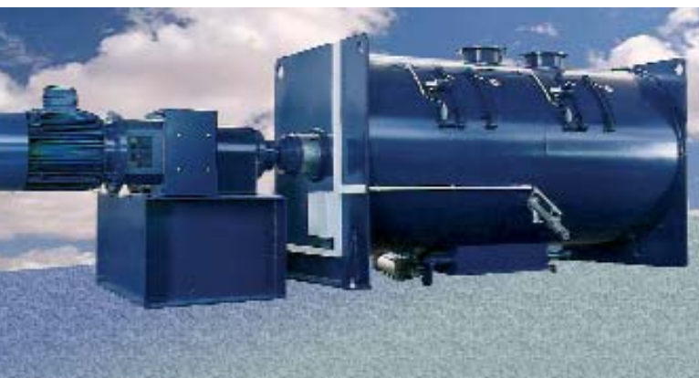
Misturador por batelada HTC 10000

O misturador por turbulência HTC é o centro do processo. Com um volume interno total de 140 – 12.000 litros, poderá ser projetado para atender suas especificações. Na maioria dos casos, o misturador pode ser alimentado através de sistema de silo de pesagem.