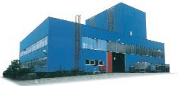
Centro Técnico em Buxtehude

Esteja sua empresa procurando por mistura contínua ou mistura por bateladas, podemos fornecer os dois tipos de sistema. O fator decisivo da escolha do processo é a qualidade da mistura a ser obtida. Como o material específico será recebido na planta? Como deveria ser o sistema projetado e equipado para atender suas necessidades? Trabalhando em conjunto com nossos clientes, nossos especialistas do Centro Técnico encontrarão as soluções para estas e também outras questões.