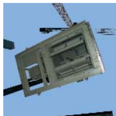
Conjunto de um misturador por batelada com sistema de descarga por duplo flap