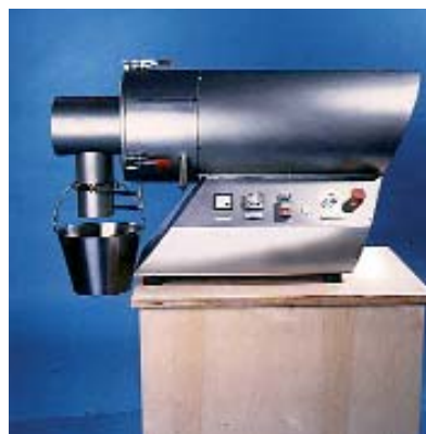
Misturador do Laboratório

Como alternativa, podemos fazer testes em nosso Centro Técnico com nossos especialistas, ou então fornecer um misturador de testes em regime de empréstimo.