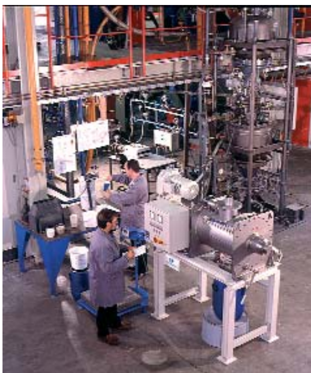
Sistema de testes de mistura no Centro Técnico

Nosso misturador de laboratório é projetado com um volume bruto de 3 litros, facilitando diferentes aplicações em ciência, tecnologia e teste de materiais. Nosso misturador de testes, com volume bruto de 140 litros, é ideal para desenvolver novos produtos com garantia de qualidade. Testes preliminares com estes equipamentos fornecem dados aplicáveis ao seu produto, evitando decisões incorretas.