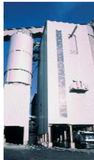
Planta de Mistura de materiais de construção para 180 t/h

Por exemplo, executando testes de campo sobre tempos de mistura, qualidade e utilização de diferentes materiais básicos num misturador, teremos informações que podem ser base de uma decisão de investimento.