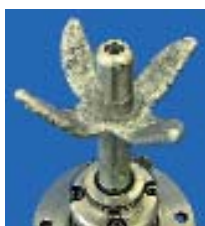
Pás tipo tulipa

Este conceito de mistura é utilizado em toda a parte interna do corpo do misturador, obtendo-se uma alta qualidade de mistura em todo o volume do equipamento.