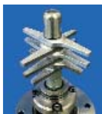
Pás de múltiplo estágio