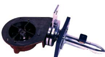
Claudius Peters Packer Turbine