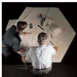
Apoyo de ingeniería de Claudius Peters