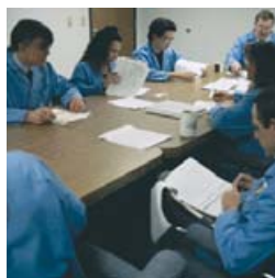
Servicio de entrenamiento para el mantenimiento