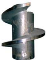
Repuestos de bomba Claudius Peters