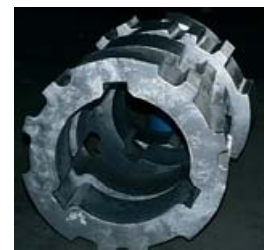
Anillo triturador de enfriador de clinker Claudius Peters