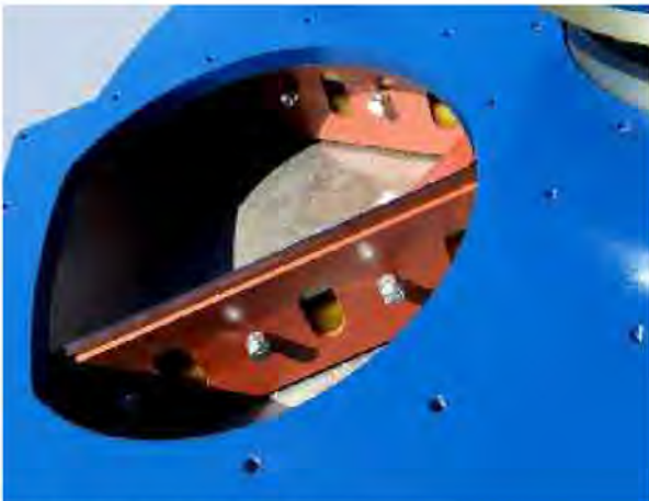
Inlet area with adjustable sealing strips