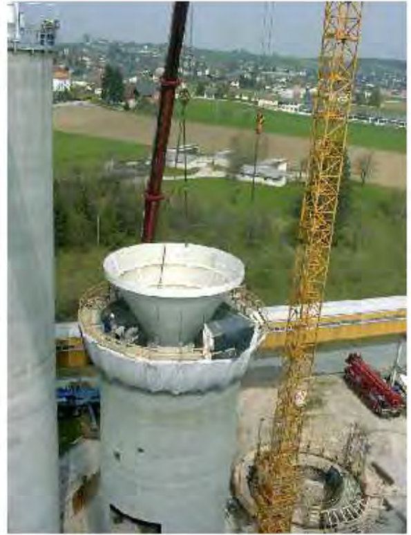
CC Silo under construction

تجهیزات تخلیه کلادیوس پیترز در قسمت دریچه های انسداد تخت سیلو جعبه ها را تغذیه مینمایند و دریچه های کنترل جریان تخلیه تنظیم شده را تضمین میکنند .