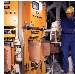
Station d'ensachage Claudius Peters