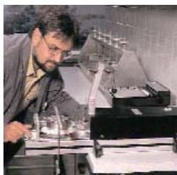
Tests en laboratoire