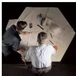
Supporto ingegneria Claudius Peters