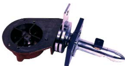
Ricambi insacchatrice Claudius Peters