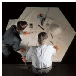
Suporte de engenharia da Claudius Peters