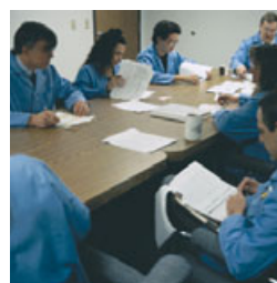
Treinamento de Manutenção