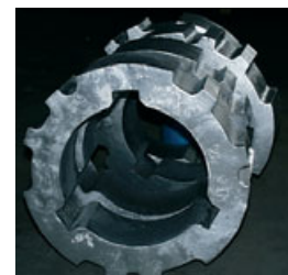
Anel de Britador de Resfriador Claudius Peters