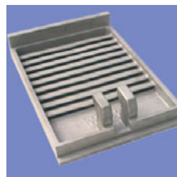
Placa de Grelha de Resfriador Claudius Peters