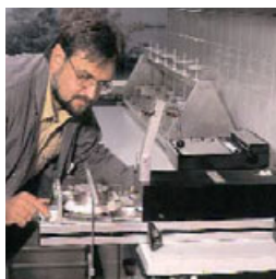
Testes em Laboratório