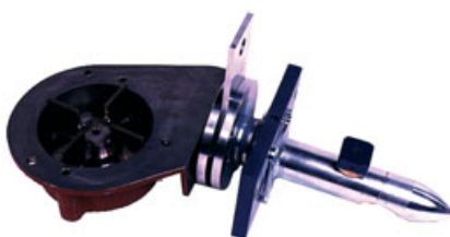
Peças de Ensacadeira Claudius Peters