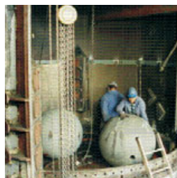
Serviços em Sistema de Moagem Claudius Peters