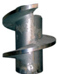
Peças de Bombas Claudius Peters