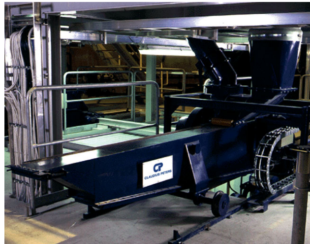
Мобильный погрузчик с диапазонами передвижения от 1 до 15 м