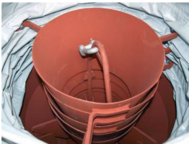
Загрузочное устройство с внешним складчатым рукавом и износостойкими конусами для абразивных материалов (например, золы уноса)

Помимо стационарных загрузочных устройств для простейших установок загрузки в грузовики, могут быть реализованы диапазоны передвижения от 1 до 15 м.